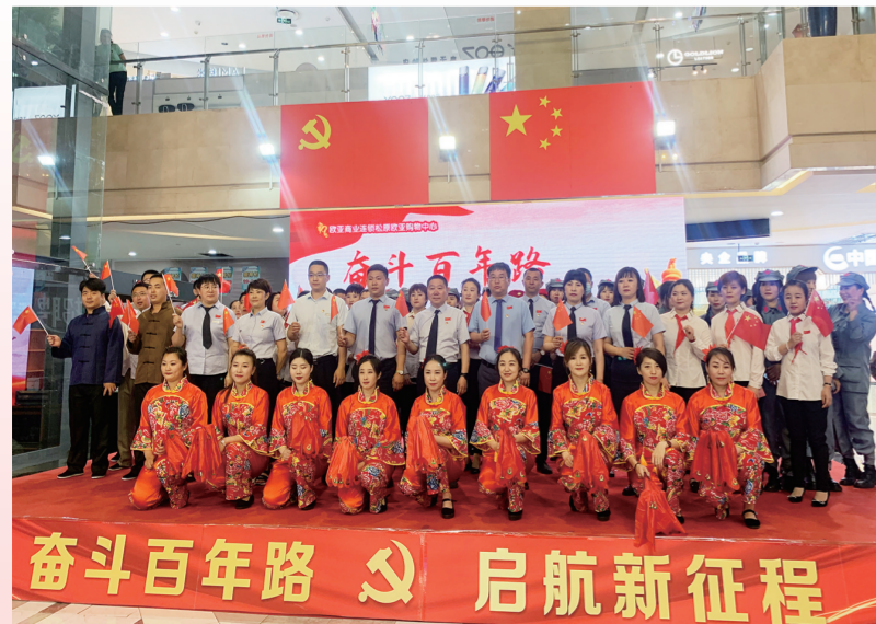
松原欧亚建党100周年文艺汇演合影。

扎实开展好党史学习教育，进一步引导党员、干部在红色教育基地重温党的百年辉煌历史，感受党的奋斗历程和伟大成就，6月10日，松原欧亚党支部联合松原经开区党委以及松原市中影国际影城开展了松原大区2021年全体党员学习“传承红色基因，牢记初心使命”主题活动，党员代表共计20余人参加了此次活动。