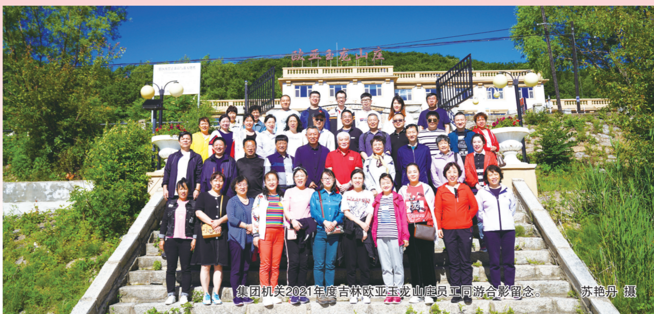
集团机关2021年度吉林欧亚玉龙山鹿茸产业园同游合影留念。