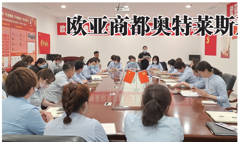
欧亚商都奥特莱斯两店开展会员维护交流座谈会。

有人自由发挥,一针一线,有模有样,再经过彩珠和流苏的装饰,一个个精美的香包便打造完成。大家互相欣赏,互相夸奖,交换赠送,合影留念,分享朋友圈……。在沙龙活动中,会员朋友们一起加入欧亚沈阳联营会员福利微信群,进一步壮大了欧亚沈阳联营会员大家庭,在收获快乐的同时又收获了友谊。