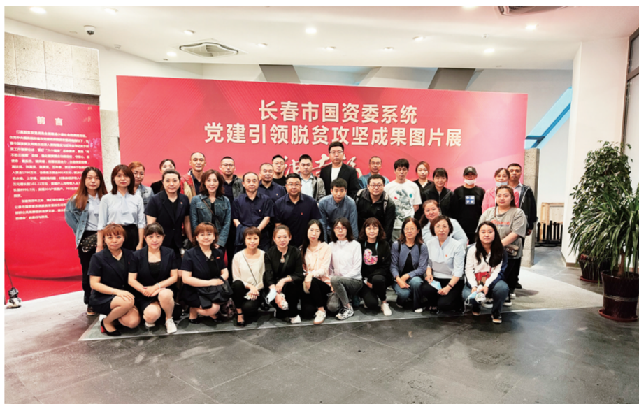
6月17日，欧亚商都党委组织部分党员参观了由长春市国资委系统党建引领脱贫攻坚成果图片展。

通过参观学习，看到企业在脱贫攻坚中所取得的成绩，我深为自己是欧亚人而骄傲和自豪。这份深深的自豪感来自于学习贯彻习近平总书记对脱贫攻坚工作重要指示精神，欧亚集团把打赢脱贫攻坚战作为重大政治任务，以过硬的工作作风克服疫情影响，推动脱贫攻坚各项任务落实到位、取得实效，坚决打赢脱贫攻坚战，为全面建成小康社会贡献力量。