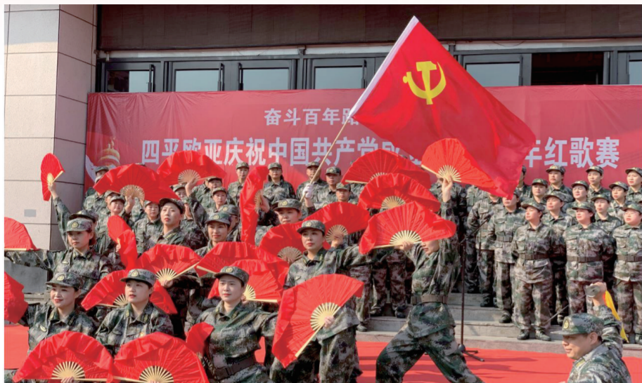
四平欧亚庆祝中国共产党成立100周年红歌赛现场。

本报讯（四平欧亚 党支部）为庆祝中国共产党成立100周年，6月21日6时50分，四平欧亚商贸有限公司党支部举行了“奋斗百年路 启航新征程”庆祝