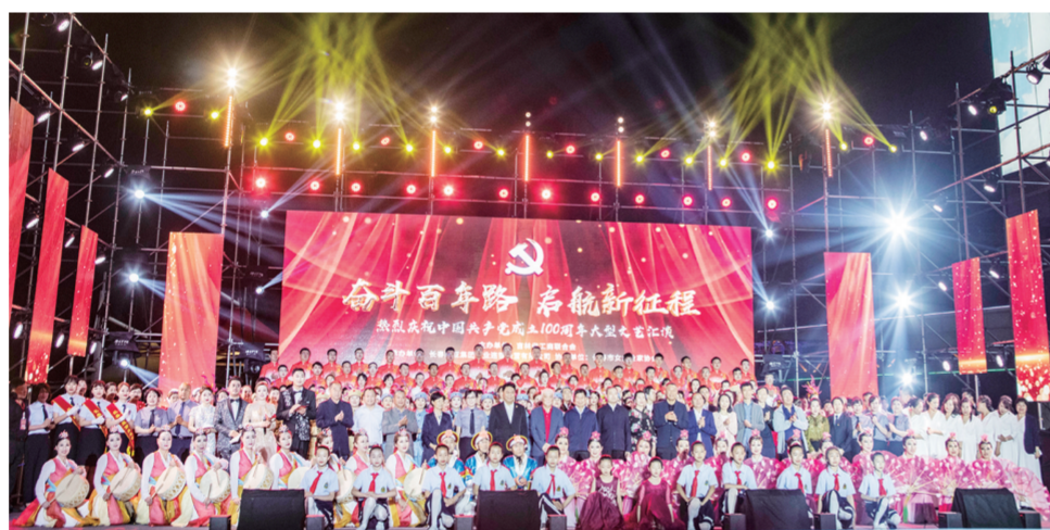
欧亚商业连锁庆祝建党100周年活动现场。

6月15日,欧亚商都党委组织全体党员参加了由长春大学主办的大型民族歌剧《江姐》。以地下党员江姐牺牲前的七个场景,从不同侧面深刻展示了共产党员面对丈夫牺