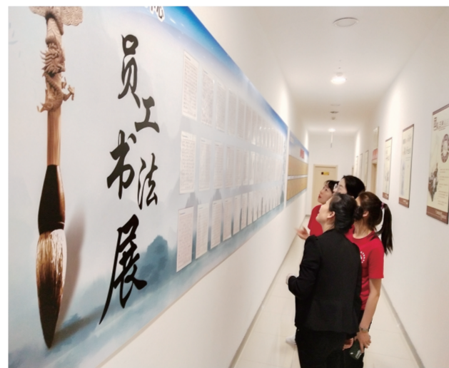
员工在观看书法展。

9:00，松原欧亚党支部书记郑伟带领全体党员来到中影国际影城观看红色题材电影《悬崖之上》，接受思想洗礼，锤炼党性修养。13:30，虽然天公不作美，下着蒙蒙小雨，但也阻挡不了松原欧亚党员们学习党史的热情。很早大家都自觉佩戴党徽，早早来到松原市经开区党委党史陈列馆，在工作人员的指引下，文明有序地进入馆内，讲解员向参观人员进行了集中讲解，陈列馆中多幅珍贵历史照片和文献资料，充分展示我国悠久历史文化。一段段详实的记录，一幅幅珍贵的图片，为全体党员干部上了一堂生动的党课。参观中，大家认真听取讲解员介绍，不时驻足观看，交流心得体会。最后，松原大区全体党员与开发区党委工作人员合影留念。本次主题党日活动，使全体党员深刻感受到了我党发展的巨大变化，引导党员进一步坚定理想信念，加强自身的责任意识。党员们纷纷表示，在今后的工作与生活中将继续发挥党员的模范带头作用，勇于担当，善于作为，立足岗位，发光发热，为党的百年华诞献礼！