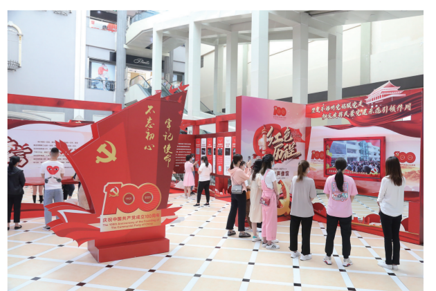
消费者在欧亚卖场党史声像馆学习。

今年,庆祝中国共产党成立100周年,欧亚卖场党委开展了一系列庆祝活动,设立“不忘初心、牢记使命”党史图文展区,通过微信定期给员工推送党史大事和红色短视频,组织员工早班会学党史、观看红色影片和大型话剧《江姐》,举办党员主题党日、团员“青春向党”故事分享会和员工党史书法展,有力地激发企业员工爱党爱国爱企之情同时,更营造了党史学习教育宣传的浓厚氛围,让更多走进欧亚卖场的员工、合作伙伴和消费者受教育、受触动、受感染,为欧亚集团的稳健发展和“三星战略”稳步实施汇聚起磅礴动力。