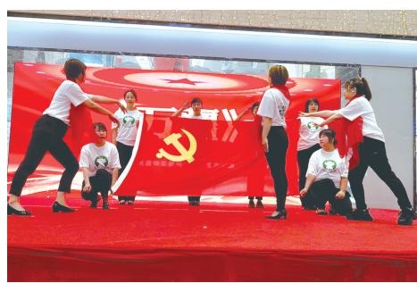
文艺汇演,集体舞《万疆》演出现场。

活动现场,欧亚沈阳联营党委组织党员重温入党誓词。铿锵有力的誓言久久回荡,让每一名党员都汲取了奋进的力量,坚定前行的步伐,在企业创新发展新征程中奋勇争先。本次文艺汇演呈现在舞台上的开场舞蹈《万疆》、集体朗诵《梦想创造未来》《超市的颜色》、情景演讲《真情守恒筑梦远航》《欧