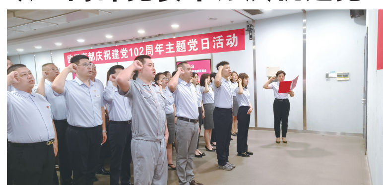
欧亚商都主题党日活动现场。

本报讯(欧亚商都 办公室)为庆祝中国共产党成立102周年,进一步鼓舞斗志、激昂士气,团结带领各党支部和全体党