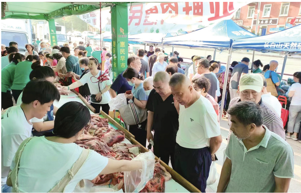
欧亚生鲜早市的品质、品牌商品受到百姓欢迎。

本报讯(欧亚超市连锁 刘秀丽)早市是展现城市居民活力的重要载体,每天清晨,市民朋友们走走停停流连于各个欧亚超市门前的早市摊位之间,使得欧亚的清晨就开始热闹起来,在丰富的商品中,总能寻觅到自己中意的商品。欧亚生鲜早市之所以能够吸引广大的消费者前来,主要依靠的就是早市售卖商品的高质量、价格低。