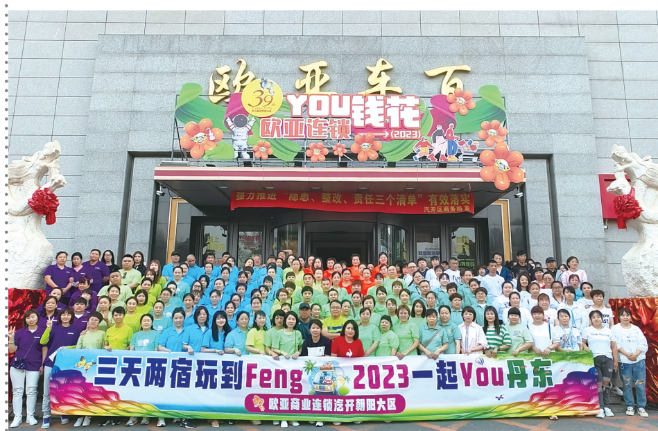
欧亚车百欢乐员工同游。

6月28日，我怀着激动的心情踏上了开往丹东的汽车，开启了欧亚商业连锁汽开朝阳区2023员工同游活动三天两晚的旅游行程。一路欢歌笑语，六个小时的车程似乎并没觉得多久，我们就来到了这座屹立在东北一角、靠海傍江的城市——丹东。