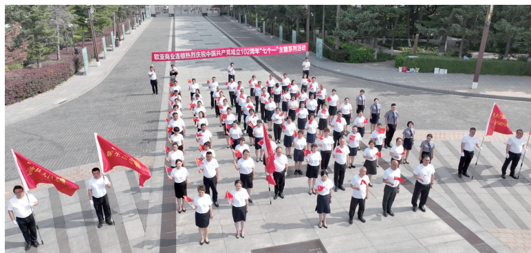
欧亚商业连锁党员重温入党誓词。

本报讯(欧亚商业连锁 隋凌云)为贯彻落实习近平新时代中国特色社会主义思想主题教育的工作要求,欧亚商业连锁党委在长春、外埠区同步开展了主题为“赓续红色血脉,勇担时代使命”庆祝建党102周年主题党日活动。