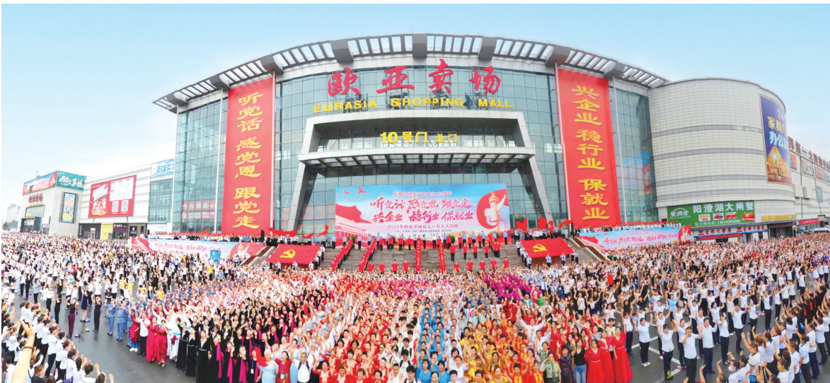
欧亚卖场庆七一万人合唱活动盛况。

本报讯(欧亚卖场 党群办)6月29日,由欧亚卖场、吉林广播电视台都市频道等联合举办的“听党话 感党恩 跟党走 兴企业 稳行业 保就业”庆祝中国共产党成立102周年万人合唱在欧亚卖场十号门外广场盛大举行。在欧亚卖场非公党建的凝聚引领下,包括欧亚卖场员工、合作商党员以及公安干警、高校、企事业单位、社区合唱团等在内的近万人现场高歌,共同为走过102年辉煌历程的中国共产党献上深情真挚祝福。