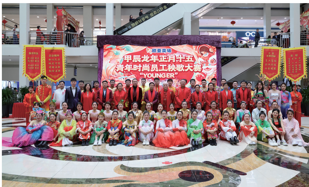
欧亚卖场正月十五秧歌大赛领导与员工合影留念。

生机融合发展理念推进调整升级,家电展位竞拍创收1.0232亿元,创造世界商业奇迹;省内首个购物中心室内生态广场亮相,客流如织,荣誉连连;东三省首个集童装、童娱、童趣于一体的高端儿童业态聚集区——童装风向开业,数个国内外知名童装品牌销售目标锁定千万以上,全国罕有。厚植优势同时全年落地300余场人气活动,一百余个品牌销售超千万以上,尤其,周大福销售超2亿元,联发、老凤祥、迪桑特、华为超1亿元,涌现出6个全国销冠、35个东三省销冠、32个吉林省销冠,不仅南非空军司令夫人和市长家人点名专程到卖场观光购物,港区全国人大代表、太平绅士李应生,敏华控股董事局主席、香港太平绅士黄敏利,以及波司登、天王表等200多个知名品牌创始人和总裁为卖场23周年庆发来祝福视频,各大主流媒体大篇幅连续报道,安踏、七匹狼、乔丹等头部品牌老总亲临卖场调研后,纷纷表示投首店、扩大店、建新店,对省市良好营商环境和未来发展前景充满信心。